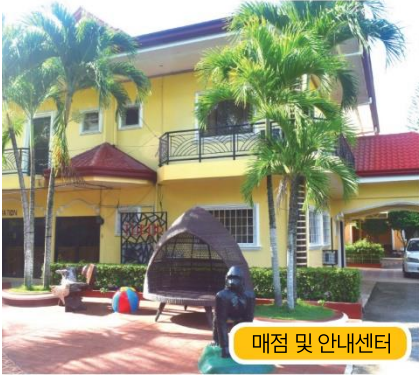
매점 및 안내센터